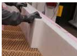
Pomocou PU peny sa na polystyrén prilepi tepelná izolácia venca.