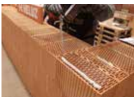
Tvarovky sa murujú na PU penu HELUZ.