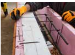
Pred betonážou sa vrchná strana spojí sponami, ktoré sa zatlačú do úrovne hornej hrany venca.