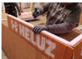
Založenie rohov a stabilizácia tvaroviek pomocou natlákačích kotiev.