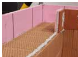
Najprv sa muruje na vonkajšom líci muriva a následne na vnútornej strane.