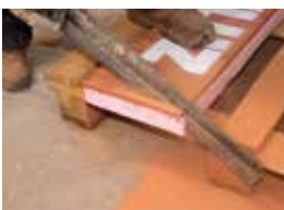
Tvarovky sa dajú ľahko a precízne opracovať.