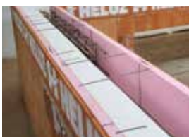
Uloží sa výstuž venca.