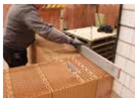
Kontrola rovinnosti muriva.