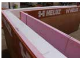
Tepelná izolácia je položená, skontroluje sa tesnosť styčných škár na vnútornej strane venca.