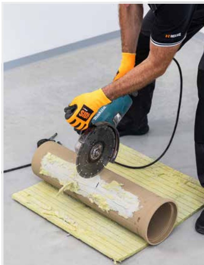
VLOŽKY SA REŽÚ UHLOVOU BRÚSKOU S VHODNÝM KOTÚČOM