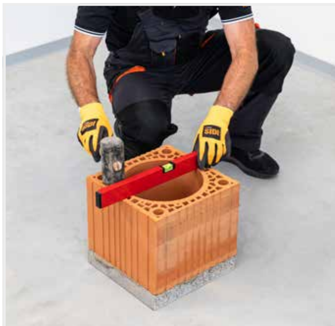
OSADENIE PRVEJ KOMÍNOVEJ TVAROVKY A JEJ PRESNÉ VYROVNANIE