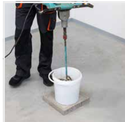
ROZMIEŠANIE MUROVACEJ MALTY