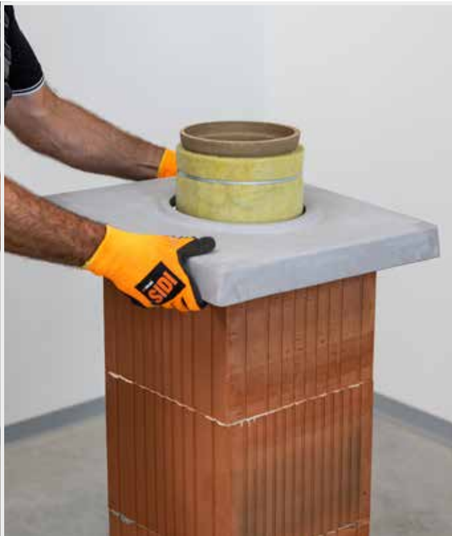
OSADENIE KRYCEJ DOSKY NASUCHO NA NAMERANIE DETAILU UKONČENIA