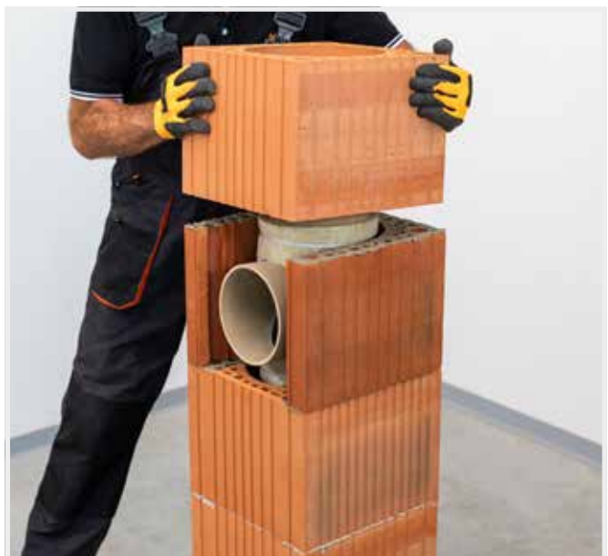
POKRAČUJE SA V MUROVANÍ