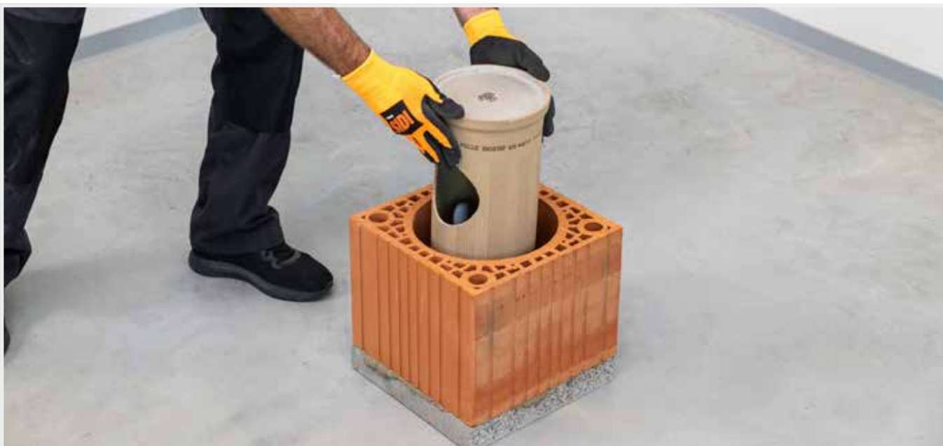
OSADENIE ZBERAČA KONDENZÁTU