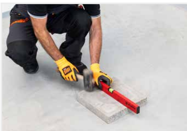
VYROVNANIE ZAKLADACEJ DOSKY