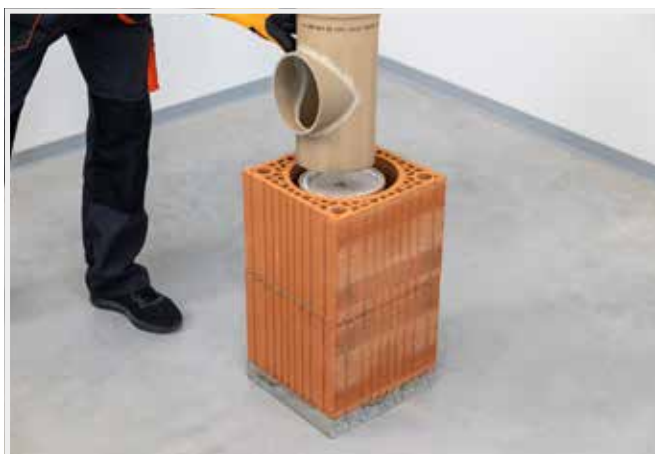
OSADENIE VYBERACIEHO OTVORU (TVAROVKA BEZ IZOLÁCIE)