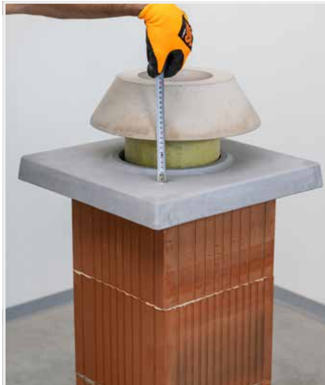
NAMERIA SA POTREBA SKRÁTENIA PO- SLEDNEJ KOMÍNOVEJ VLOŽKY