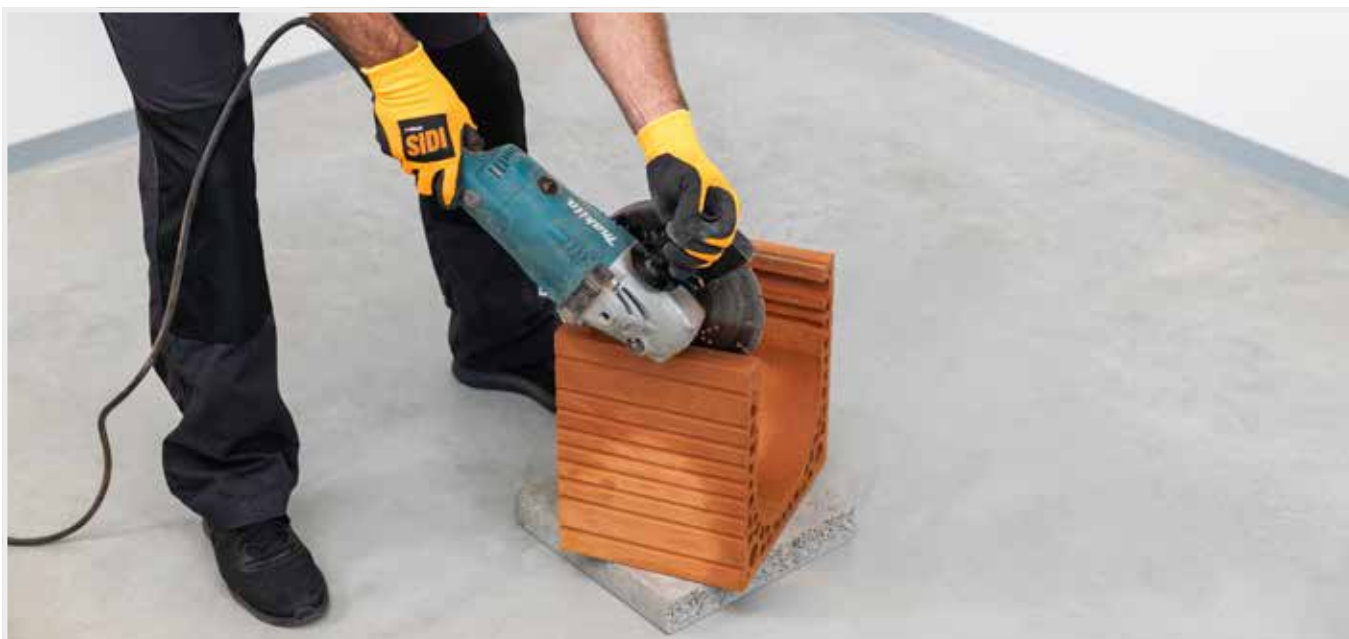
TVAROVKY SA VYREŽÚ PODĽA POTREBY