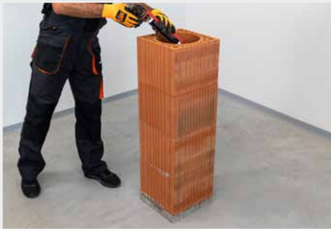
NANESENIE ŠKÁROVACIEHO TMELU DO KAŽDÉHO HRDLOVÉHO SPOJA