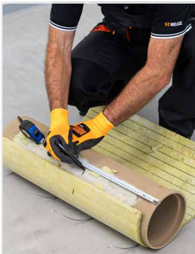
MOŽNOSŤ REZANIA VLOŽKY NA DOSIAH- NUTIE POŽADOVANEJ VÝŠKY SOPÚCHA