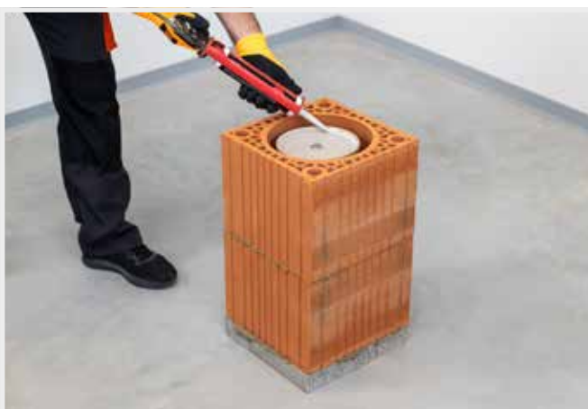
NANESENIE ŠKÁROVACIEHO TMELU DO ZBERAČA