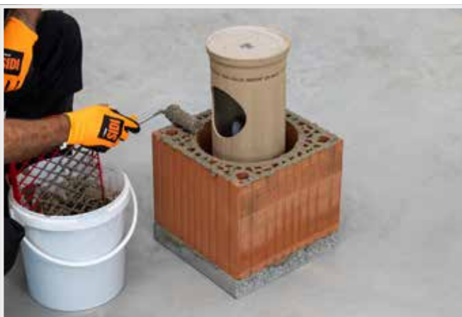
NANÁŠANIE MUROVACEJ MALTY NA LOŽNÚ ŠKÁRU