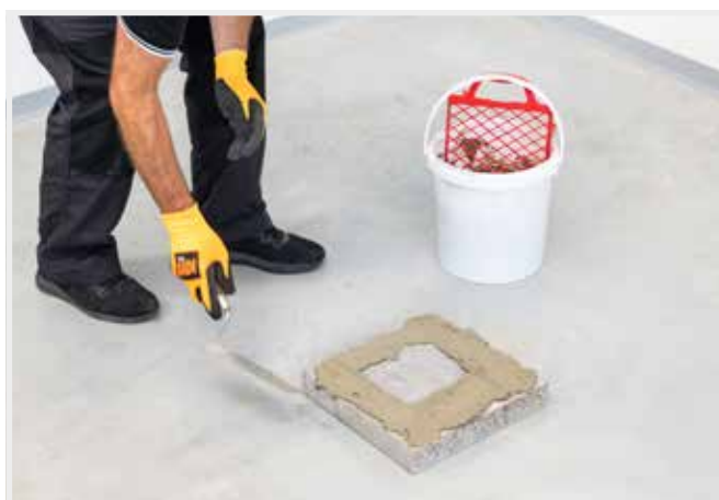
NANESENIE MUROVACEJ MALTY