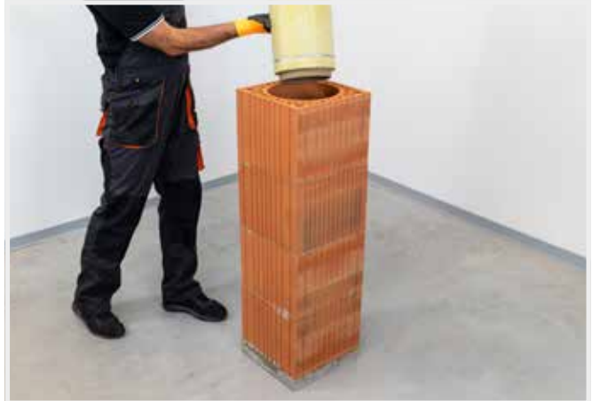
VKLADANIE UŽ Z VÝROBY IZOLOVANEJ VLOŽKY