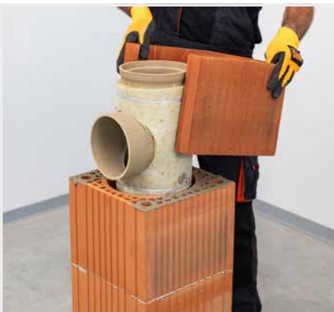
OSADENIE VYREZANEJ TVÁRNICE